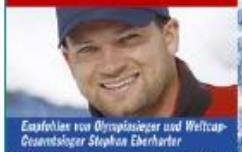
Erzähler von Olympiasieger und Weltcup-Gewinnler Stephan Eberhart

SKI-optimal HOCHFÜGEN HOCH ZILLERTAL FÜGEN - KALTENBACH