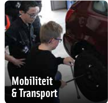
Mobiliteit & Transport