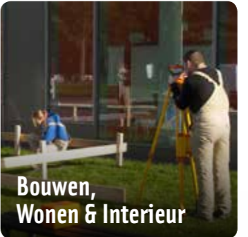
Bouwen, Wonen & Interieur