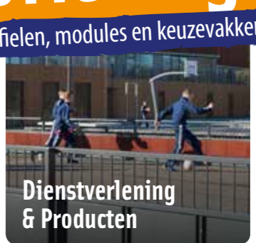
Dienstverlening & Producten