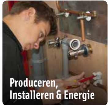
Produceren, Installeren & Energie