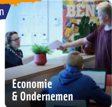
Economie & Ondernemen